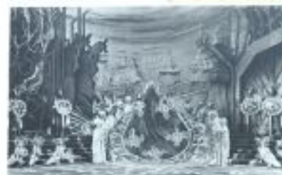
"Legenda Bałtyku"