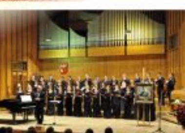
Uroczysty koncert z okazji Roku Feliksa Nowowiejskiego w Olsztynie