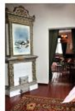
Dom rodzinny Feliksa Nowowiejskiego w Barczewie obecnie Muzeum F. Nowowiejskiego